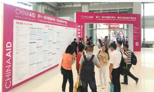
China Aid 开幕